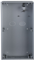
- Unterputzrahmen für Modular Türstationen

Einbaurahmen für Türsprechanlage, Unterputz, für 2 Module (Blende L-BL-5702 wird zusätzlich benötigt)